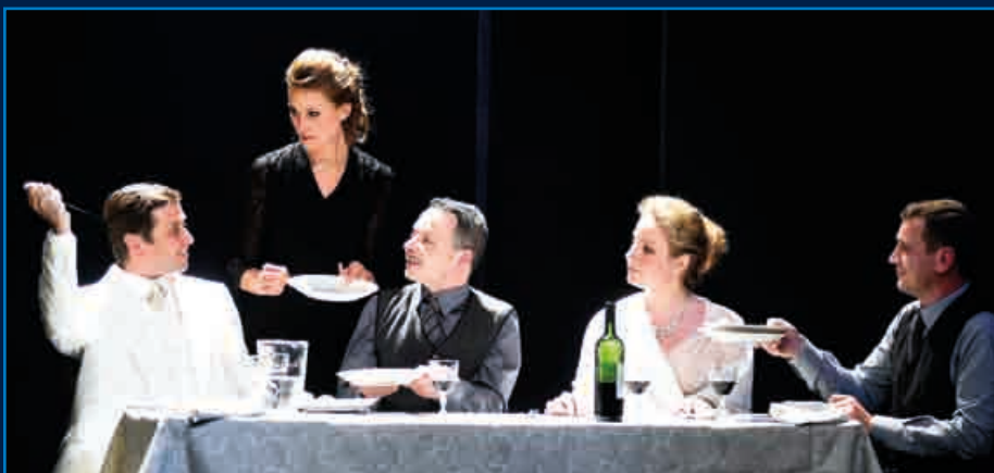
L'abus d'alcool est dangereux pour la santé.

en alternance avec Salomé VILLIERS ou Herrade VON MEIER